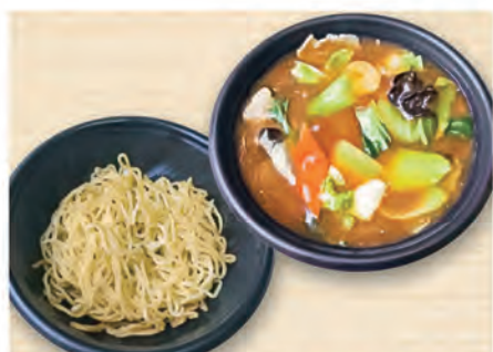
あんかけ焼きそば