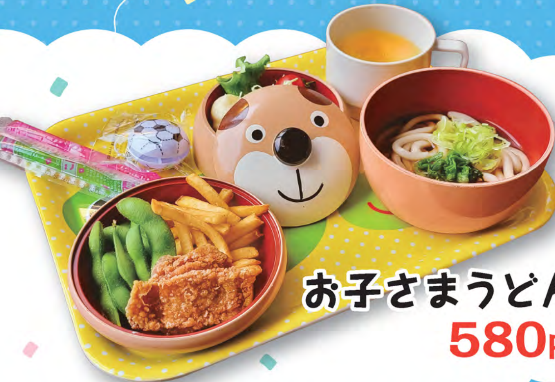
お子さまうどん 580円