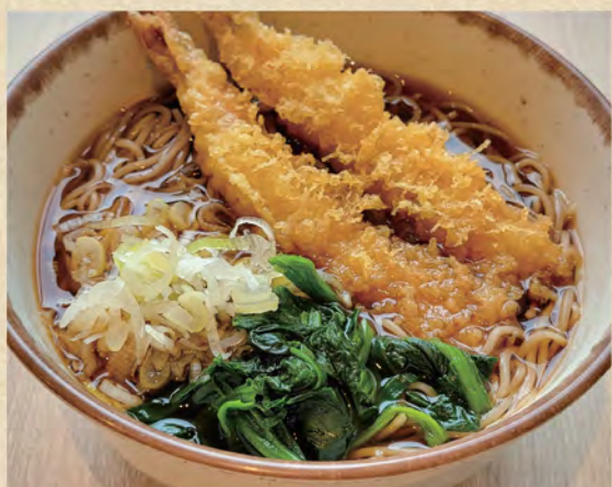
海老天 そば/うどん