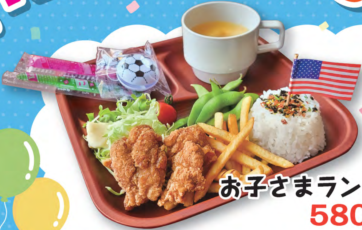
お子さまランチ 580円