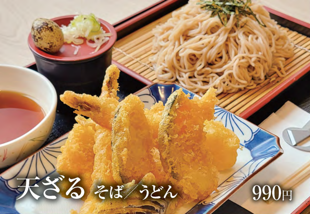
天ざる そば/うどん