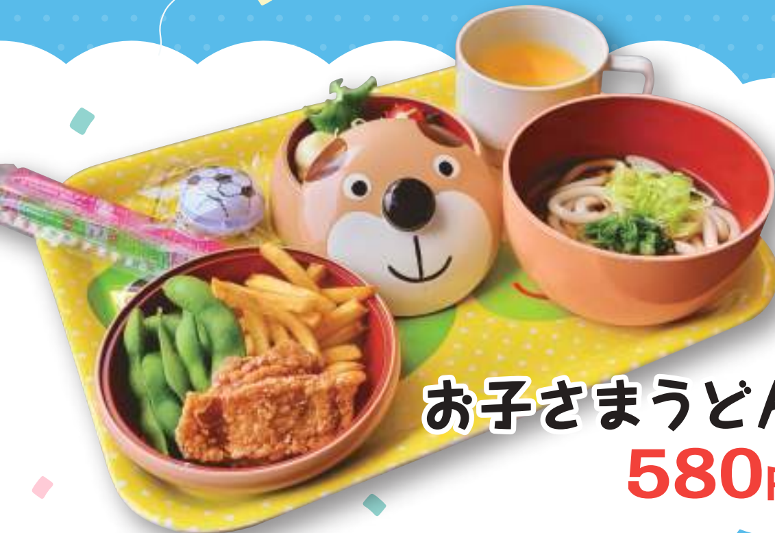
お子さまうどん 580円