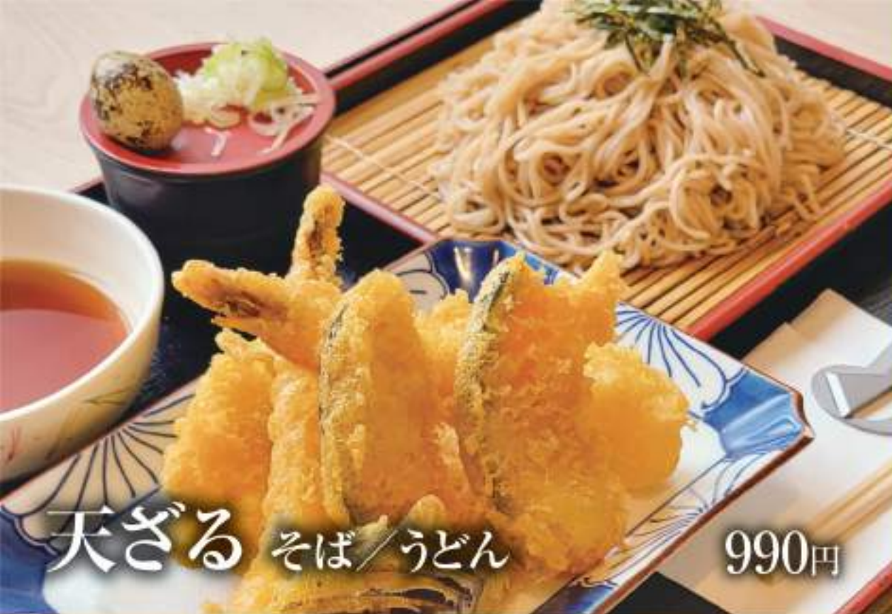
天ざる そば/うどん