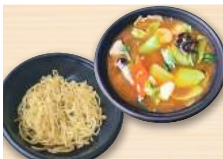
あんかけ焼きそば