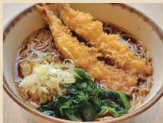
海老天 そば/うどん