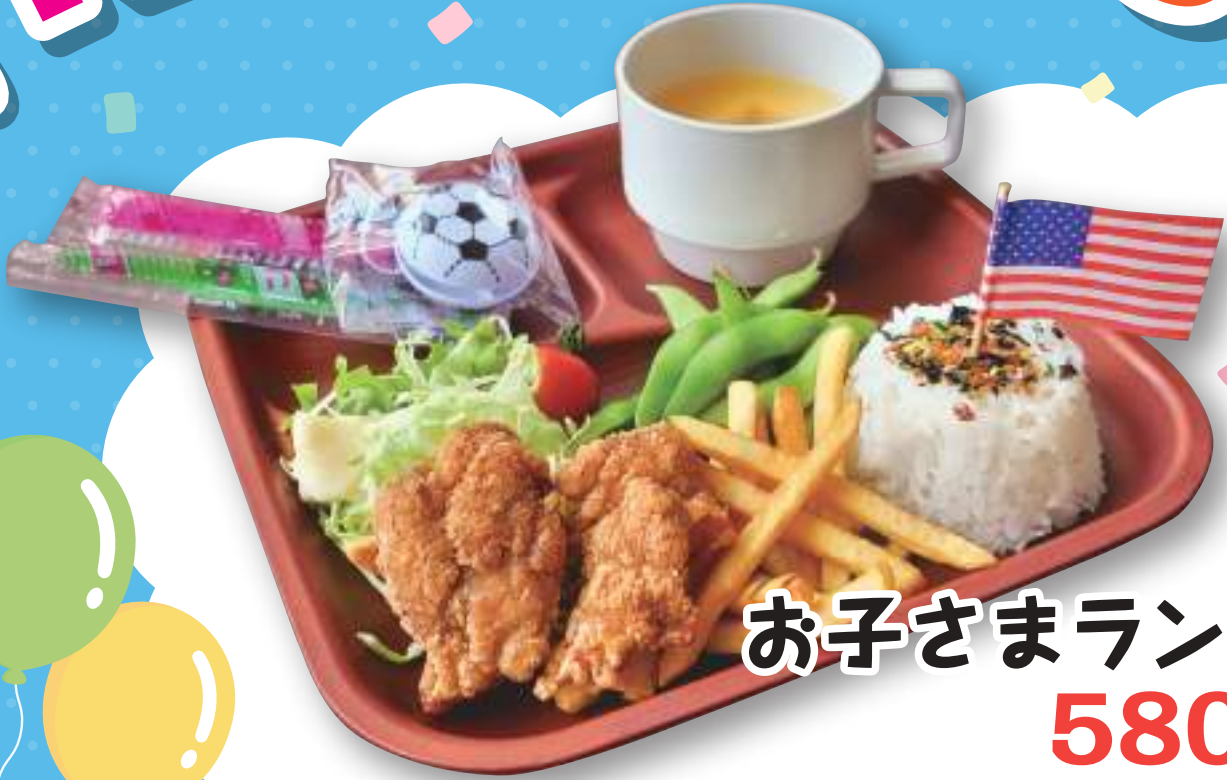
お子さまランチ 580円